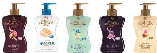
Nutriente - Marsiglia - Emolliente - Rigenerante - Idratante ID 9389