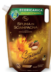
ECO RICARICA Sensual 750 ML