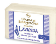
ID 30297 Saponcino Lavanda 125 gr