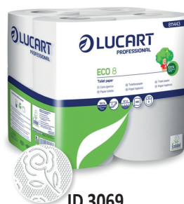
ID 3069 Bauletto 8 Rotoli