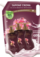
ID 21668 SAPONE CREMA ML.1500 Idratante / Marsilia / Nutriente