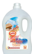
LATRICE MARSIGLIA 3 LT