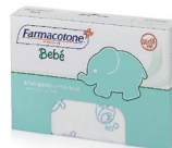
ID 18117 Teli Igienici