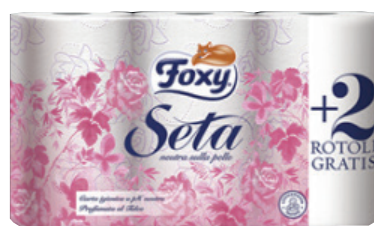
ID 2551 FOXI C.IGIENICA 4+2