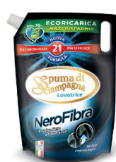
ECO RICARICA Nero Fibra 1500ML