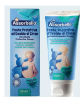
ID 27816 Pasta allo zinco