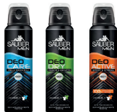
ID 24881 BLU - pelli sensibili VERDE - fresco e asciutto ARANCIO - sport e stress