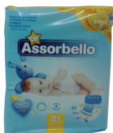
ID 30311 MINI KG.3-6