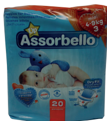
ID 26109 MIDI KG.4-9