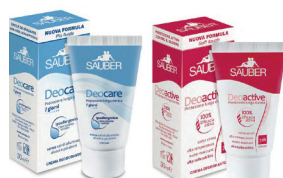
ID 31283 ROSSO 100% Efficacia attiva AZZURRO Ipoallergenico