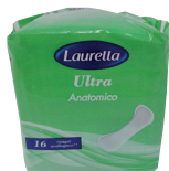
ID 31049 ULTRA ANATOMICO EASY WRAP PZ.16