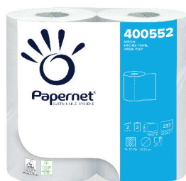
ID 22534 2 Rotoloni Carta