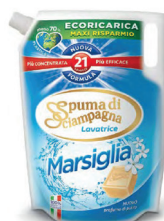
ECO RICARICA Marsiglia 1500ML