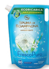
ECO RICARICA Fresco Puro 1500ML