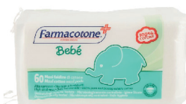
ID 18115 Faldine di cotone