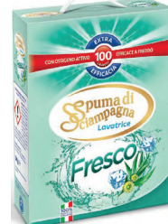
DETERSIVO FRESCO 6 KG