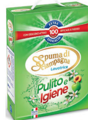
DET.VO PULITO E IGIENE 6 KG