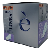
ID 13057 LINES E' - lactifless con ALI