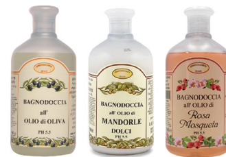
ID 26434 Olio di Oliva ID 26435 Mandorle Dolci ID 26023 Rosa Mosqueta