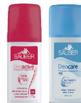
ID 31282 ROSSO 100% Efficacia attiva AZZURRO Ipoallergenico