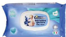
ID 27288 salviette igien.ti 64PZ