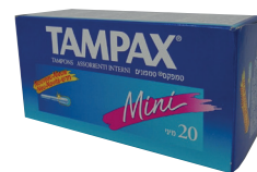
ID 232 TAMPAX CLASSIC x 20pz