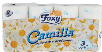
ID 164 8 Rotoli