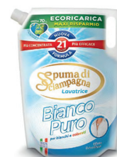
ECO RICARICA Bianco Puro 1500ML