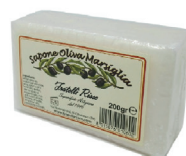
ID 28605 Saponetta Olio Oliva 200 gr