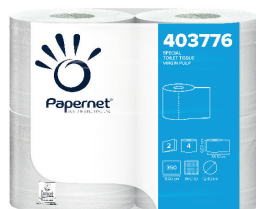
ID 17329 4 Rotoli