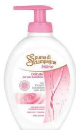
ID 31275 Delicato 250 ML