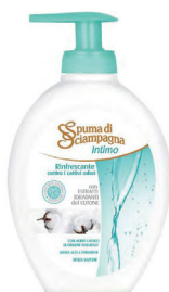
ID 9956 Rinfrescante 250 ML