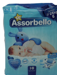
ID 26111 MIDI KG.11-25