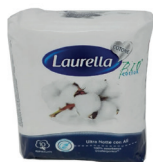
ID 28631 SOTTILE NOTTE EXTRALUNGO 10 pz