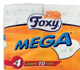
ID 16786 4 Rotoli