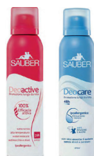
ID 31281 ROSSO 100% Efficacia attiva AZZURRO Ipoallergenico