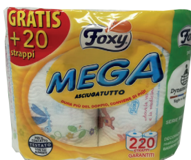
ID 31471 2 rotoli ASCIUGATUTTO