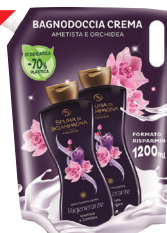
ID 32362 BAGNODOCCIA Ametista E Orchidea ML.1200