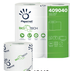
ID 15448 CARTA IGIENICA BIOTECH 4 ROT