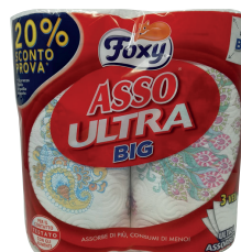
ID 31472 2 rotoli 3 veli Asso Ultra