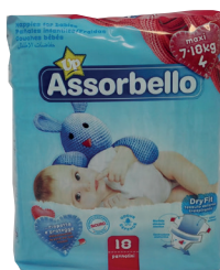
ID 26110 MIDI KG.7-18