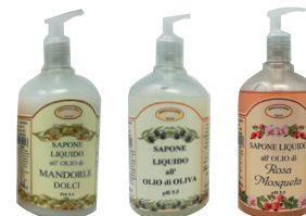
ID 26431 Olio di Oliva ID 26432 Mandorle Dolci ID 26022 Rosa Mosqueta