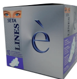
ID 13057 LINES E' - lactifless LUNGO con ALI