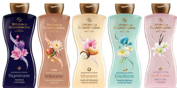
Rigenerante - Vellutante - Idratante - Emolliente - Setificante ID 28804