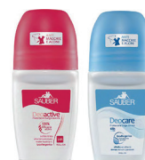
ID 31284 ROSSO 100% Efficacia attiva AZZURRO Ipoallergenico