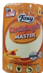
ID 18874 Carta paglia