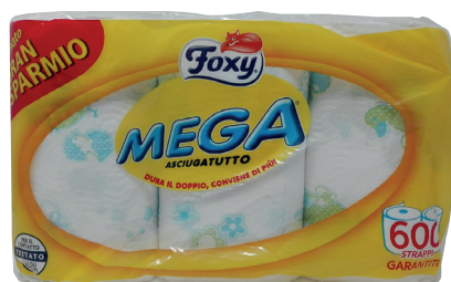
ID 15329 Foxy mega asciugatutto 6 rotolono