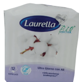
ID 26112 ULTRA ALI GIORNO