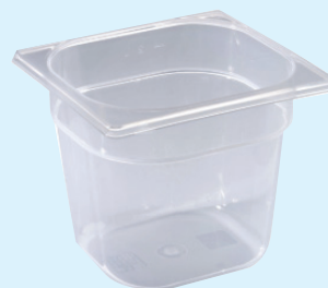
ID 31806 BACINELLA GASTR.1/6 H.65 LT.1 142/1/6/065-PP Dim: L 176 x I 162 x H 65 mm