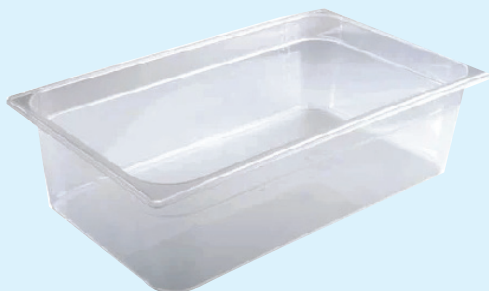
ID 17547 BACINELLA GASTR. 1/1 H.200 LT24 142/1/1/200-PP Dim: L 530 x I 325 x H 200 mm