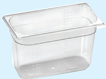
ID 10332 BACINELLA GASTR. 1/4 H.200mm. LT.4.5 PP 142/1/4/200-PP Dim: L 264 x I 162 x H 200 mm