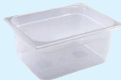
ID 17010 BACINELLA GASTR. 1/2 H.150mm. LT.8 142/1/2/150-PP Dim: L 265 x I 325 x H 150 mm