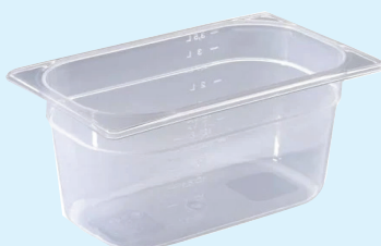
ID 31808 BACINELLA GASTR.1/4 H.65 LT.1,5 142/1/4/065-PP Dim: L 264 x I 162 mm x H 65 mm