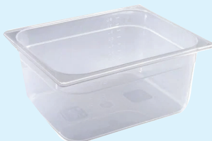
ID 17548 BACINELLA GASTR. 1/2 H.200 LT11 142/1/2/200-PP Dim: L 265 x I 325 x H 200 mm