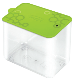
ID 18676 CONTENITORE TENGO R M FORME VERDE