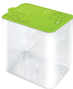
ID 18993 CONTENITORE TENGO R L FORME VERDE