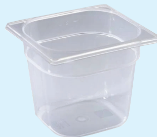
ID 30325 BACINELLA GASTR.1/6 H.200mm. LT 2,5 142/1/6/200-PP Dim: L 176 x I 162 x H 200 mm