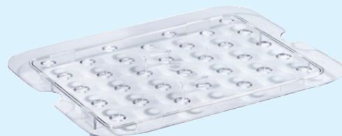
ID 31814 FALSO FONDO FORATO GASTRONORM 1/1 ID 31813 FALSO FONDO FORATO GASTRONORM 1/2 ID 31812 FALSO FONDO FORATO GASTRONORM 1/3