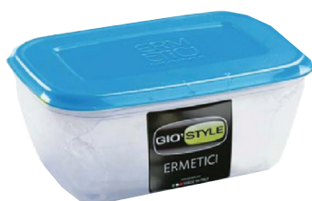
ID 1531 CONTENITORE ERMETICO RETTANGOLARE LT.3