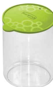
ID 4540 CONTENITORE TENGO T MIS.M