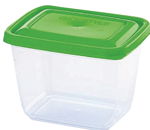
ID 26220 CONTENITORI ESSENTIAL RETTANGOLARI LT.0.7 PZ.3