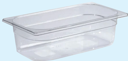
ID 31809 BACINELLA GASTR.1/3 H.65 LT.2 142/1/3/065-PP Dim: L 175 x I 325 x H 65 mm