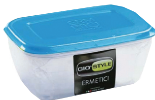
ID 10553 CONTENITORE ERMETICO RETTANGOLARE .LT.1