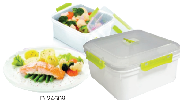
ID 24509 CONSERVO E CUCINO 2.8 L