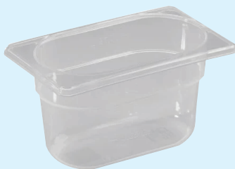
ID 18990 BACINELLA GASTR.1/9 H.100mm. LT.0,7 142/1/9/100-PP Dim: L 176 x I 108 x H 100 mm