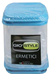
ID 7593 CONTENITORE ERMETICO QUADRO 0.25L PZ.4