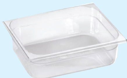
ID 31810 BACINELLA GASTR.1/2 H.65 LT.3 142/1/2/065-PP Dim: L 265 x I 325 x H 65 mm