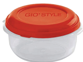
ID 26222 CONTENITORI ESSENTIAL ROTONDI LT.0.5 PZ.3