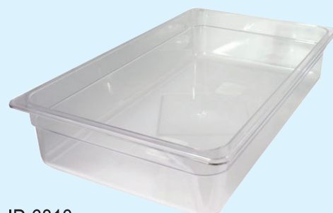
ID 6813 BACINELLA GASTR. 1/1 H.150 LT 18 142/1/1/150-PP Dim: L 530 x I 325 x H 150 mm