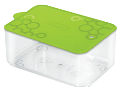
ID 18675 CONTENITORE TENGO R S FORME VERDE