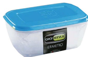
ID 15997 CONTENITORE ERMETICO RETTANGOLARE .LT.2