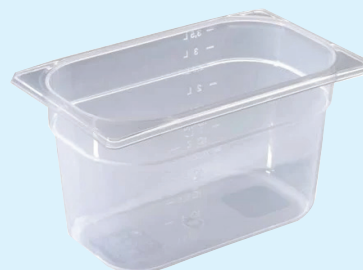
ID 17012 BACINELLA GASTR.1/4 H.150mm. LT.3,5 142/1/4/150-PP L 264 x I 162 x H 150 mm