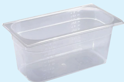
ID 30326 BACINELLA GASTR. 1/3 H.200mm. LT.7 142/1/3/200-PP Dim: L 175 x I 325 x H 200 mm