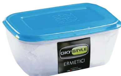
ID 10552 CONTENITORE ERMETICO RETTOLARE LT.4