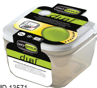
ID 13571 CONTENITORE QUADRO DUAL(FRIGO-Microonde) 1.00LT.