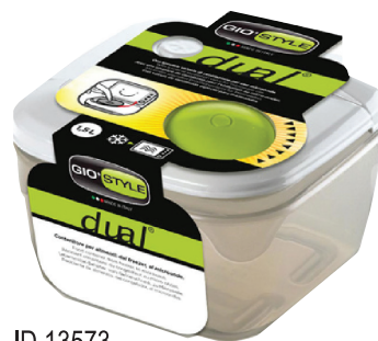
ID 13573 CONTENITORE QUADRO DUAL (FRIGO-Microonde.) 2.00LT.