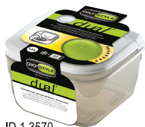
ID 1 3570 CONTENITORE QUADRO DUAL(FRIGO-Microonde.) 0.50LT.