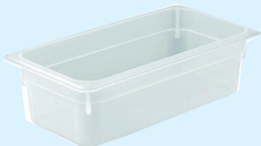
ID 17011 BACINELLA GASTR. 1/3 H.150mm. LT.5 PP 142/1/3/150-PP Dim: L 175 x I 325 x H 150 mm